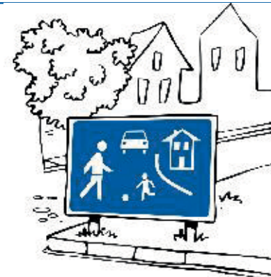
Beginn eines verkehrsberuhigten Bereiches.

Die Einhaltung dieser Regel bedeutet mehr Sicherheit und Lebensqualität für Alle!